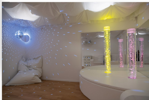
AUSZUG BROSCHÜRE FÜR ZUWEISENDE UND PATIENTINNEN UND PATIENTEN BILD 1: DAS FARBKONZEPT, DIE HANDLÄUFE UND DIE BELEUCHTUNG BETONEN DIE WEGFÜHRUNG UND LEITEN PATIENTINNEN UND PATIENTEN. BILD 2: THERAPIERAUM.