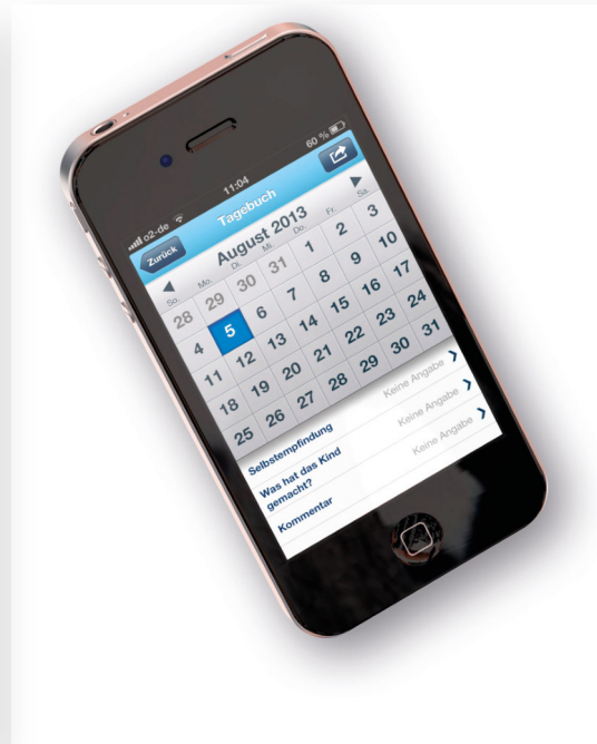
FEATURES ZUR TÄGLICHEN ANWENDUNG WÄHREND/NACH DER SCHWANGERSCHAFT