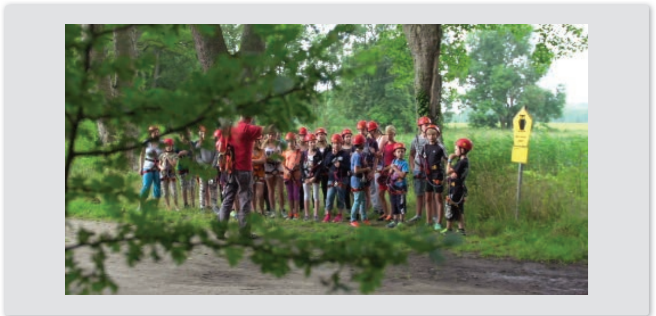
Beim Diabetes-Camp stehen Schulungen und Therapien, aber auch viele Freizeitaktivitäten auf dem Plan. Die Teilnehmer lernen dabei, wie ihr Blutzucker in welchen Situationen reagiert.