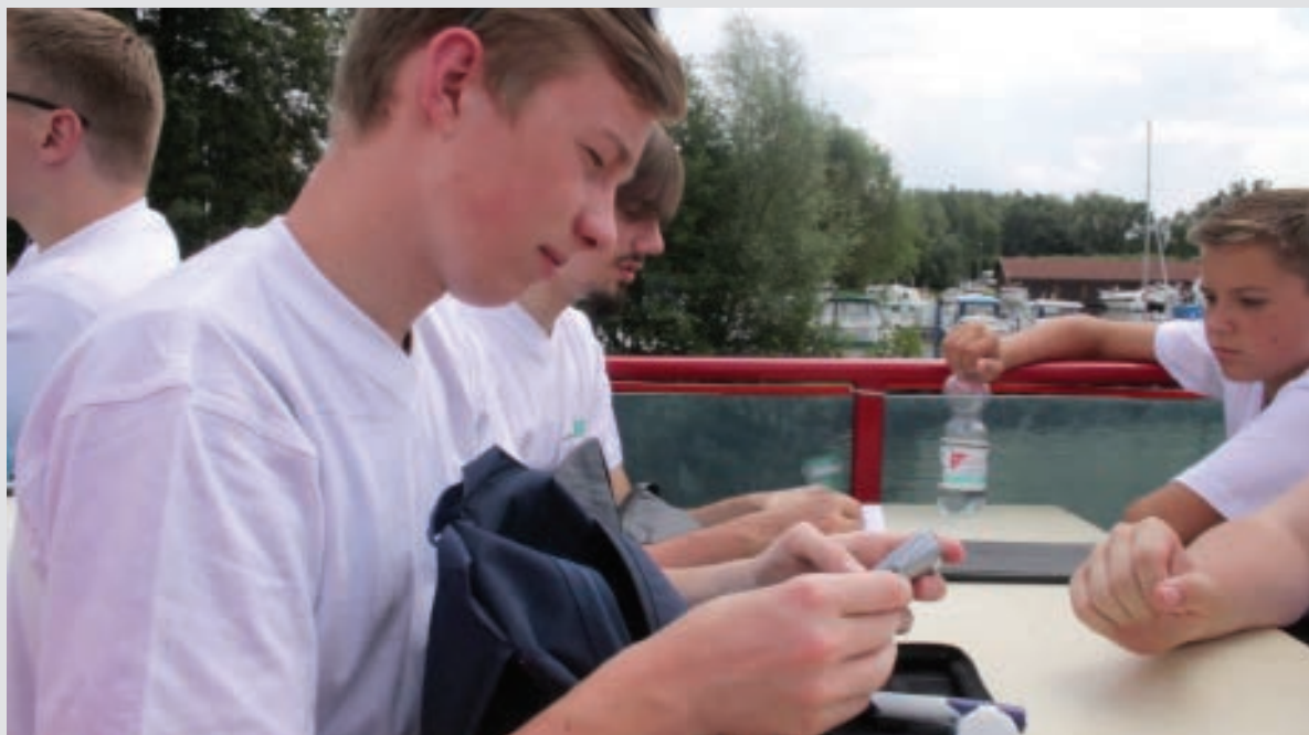
Im Diabetes-Camp überprüfen die Kinder und Jugendlichen regelmäßig die Stoffwechselsituation und erlernen ein eigenverantwortliches Diabetesmanagement.