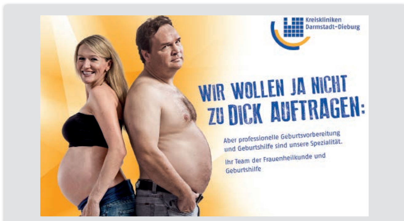
Die beiden Bilder zeigen das erste von zwei Motiven der Kampagne, jeweils mit einer anderen Headline.